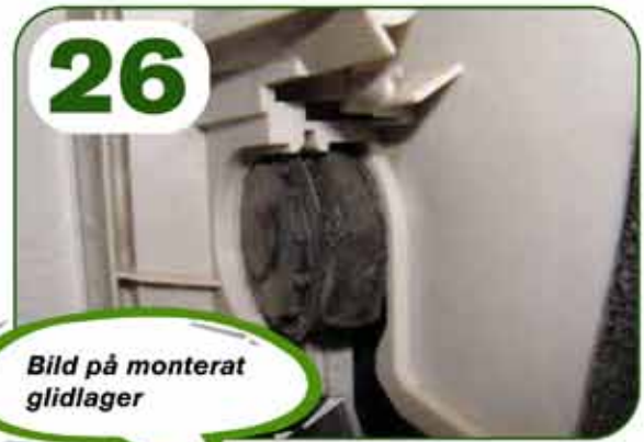
Bild på monterat glidlager